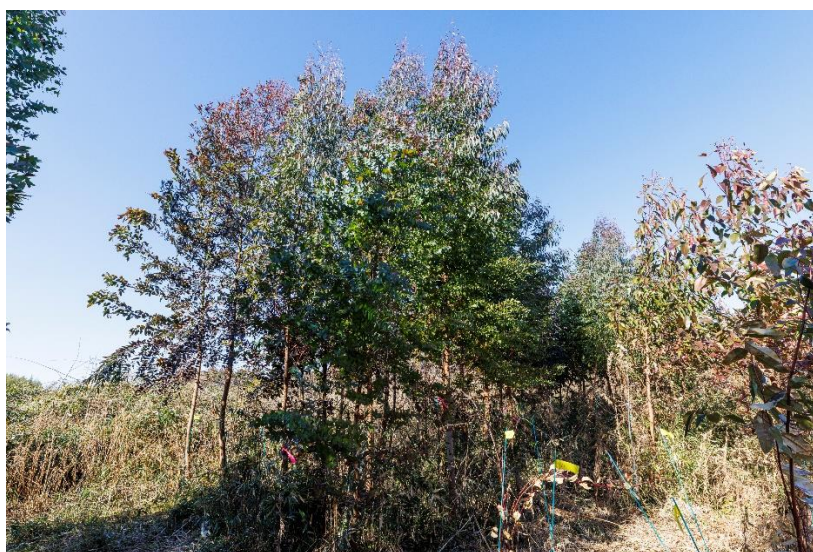
△植林し成長したユーカリ