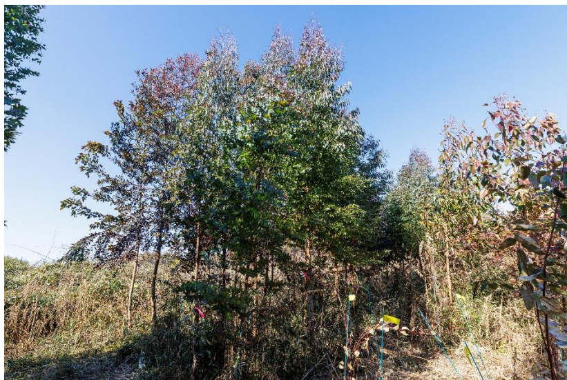
△植林し成長したユーカリ